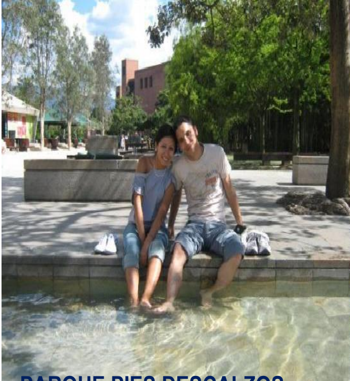
PARQUE PIES DESCALZOS